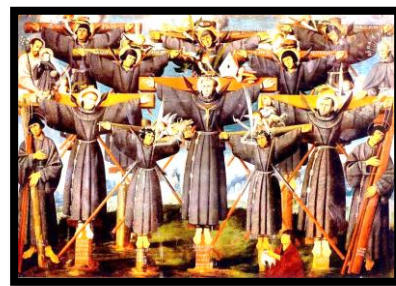
St. Paul Miki (1565-1597)

Jesús dijo " si el grano de trigo que cae en la tierra no muere, queda solo; pero si muere, da mucho fruto."