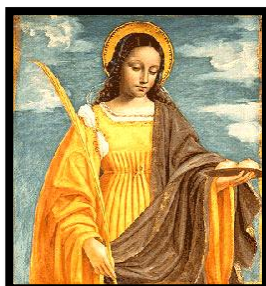
ST. AGATHA (235-251)

jueves de mes Reunión de Servidores (Lectores, Ministros Eucaristía, Directiva Emaús, Coros, Acomodadores, Catequistas, etc...) a las 7pm y su asistencia es muy requerida. Justificar su ausencia porque el servicio a Dios en la Iglesia es un regalo y privilegio y no ha de ser una carga.